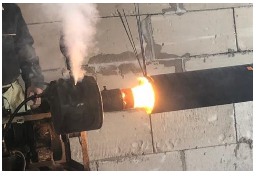
FIGURE 2 – Burning device in in work