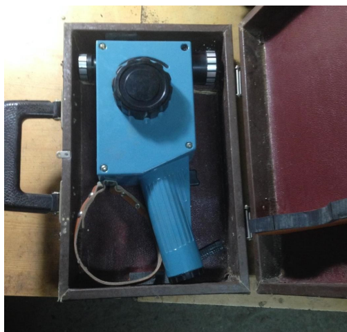
FIGURE 3 – Pyrometer with a disappearing filament