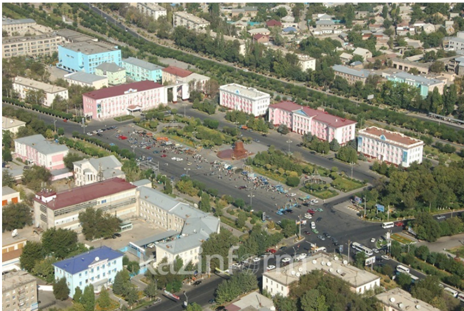
Рисунок 3. Центральная площадь города Тараза https://www.inform.kz/ru/taraz-vosstanavlivaetsya-posle-yanvarskih-sobytiy-fotoreportazh_a3888335