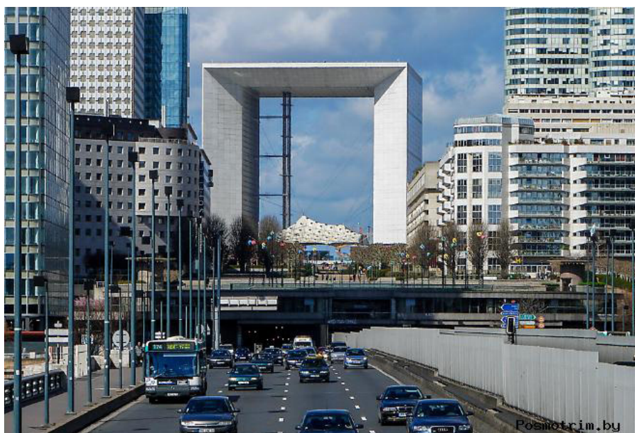
Рисунок 6. Деловой центр Дефанс в Париже [6]

Французы не были бы самими собой, не создав нечто особенное. Виды великолепны, одинаково прекрасны в дневное и вечернее время [6].