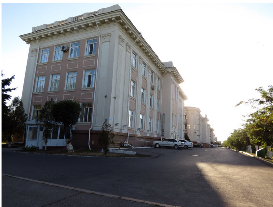
Рисунок 4. Административное здание редакции областных газет «Ак Жол», «Знамя труда» в городе Таразе https://varandej.livejournal.com/628582.html

Транспортно-пешеходная нагрузка на окружающую территорию здания с учетом посетителей, сотрудников, маломобильной группы населения только повышается, что повлечет за собой постепенную трансформацию главной городской площади - проезды к административным зданиям и места для автостоянок. Но трансформация не всегда удается городским властям, так как существующие строения вдоль улиц не позволяют провести расширение и реконструкцию городской среды.