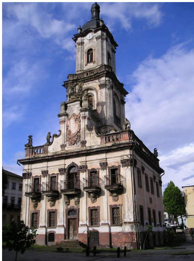
Рисунок 2. Ратуша в Бучаче [4]

Изменения касаются и городской площади, которая узко связана с административным зданием, в частности, введение дополнительных функций или трансформация в абсолютно свежее пространство. Таким образом, можно отметить положительную тенденцию в поддержании спроса на площадь с созданием дополнительных городских объемов, а также иногда усилением благоустройства и созданием скверов, торгово-выставочных площадей открытого типа. Отрицательной тенденцией, ведущей к потере объема городского пространства и сужению пространства, является поправка функции пространства, включение его в технические зоны или применение в качестве площадки для нового строительства, не связанного с административным правлением. Данная ситуация наблюдается во многих городах.