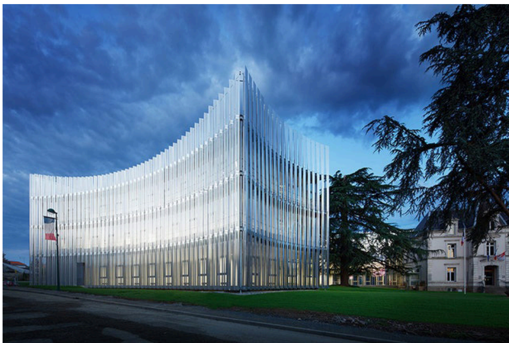
Рисунок 5. Муниципальное офисное здание в Ле-Эрбье, Франция [5]

Муниципальное офисное здание в Ле-Эрбье, разработанное французской студией Atelier du Pont , представляет собой яркий образец синтеза скульптуры с окружающей средой.