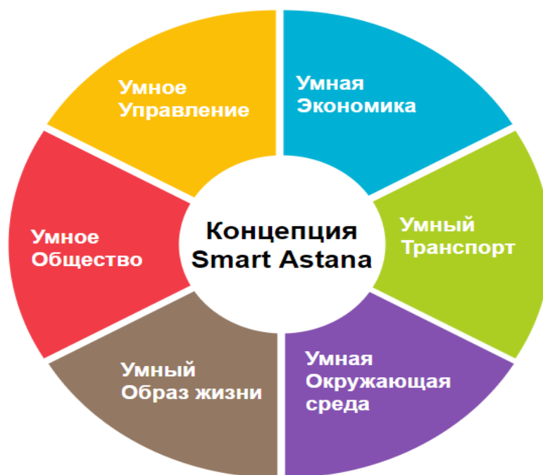
Сурет 1. Smart Astana тұжырымдамасы

Ақылды қала мультиагентті жүйелерден тұрады, бұл сипаттама ақылды қаланың инфрақұрылымы мен қоршаған ортасын құратын жүйелерінде бар ақылды технологияларды қолдануына байланысты. Олар күнделікті қалалық өмірге арналған жаңа шешімдер неғұрлым мүмкін болатындай және оларды қолдану оңай болатындай етіп жұмыс жасайды [7].