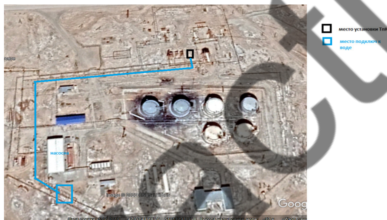
Рисунок 4 – Схема установки модуля НМТК с тепловым насосом

В настоящее время на участке подготовки нефти (УПН) месторождения Ю.З. Камышитовое нефть после РВС (резервуаров) нагревается в технологических печах ПТ-16/150 (тепловая мощность 1,6 \text{ Гкал/ч} ) по 2-х ступенчатой схеме. При проведении ОПИ планируется установить модуль с тепловым насосом на узле подогрева нефти, тем самым снизить нагрузку на технологических печах, что в итоге существенно снизит потребление топливного газа.