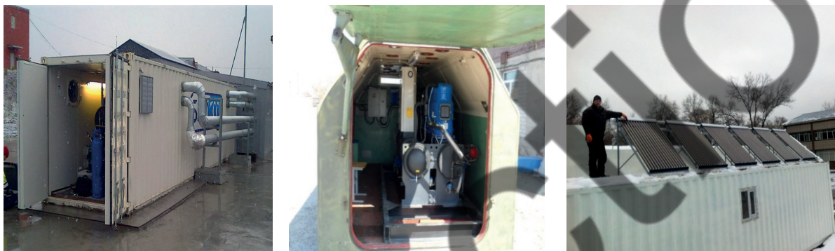
Рисунок 3 – Общий вид предлагаемого основного оборудования НМТК в модульной компоновке

НМТК с использованием альтернативных источников энергии в стационарной или модульной конфигурации представляет собой контейнер с металлической изоляцией, контейнерную опору, ограждающие конструкции, выполненные в виде трехслойных панелей, состоящих из гофрированных листов, изолированных от плит минеральной ваты (рисунок 3) [9-11].