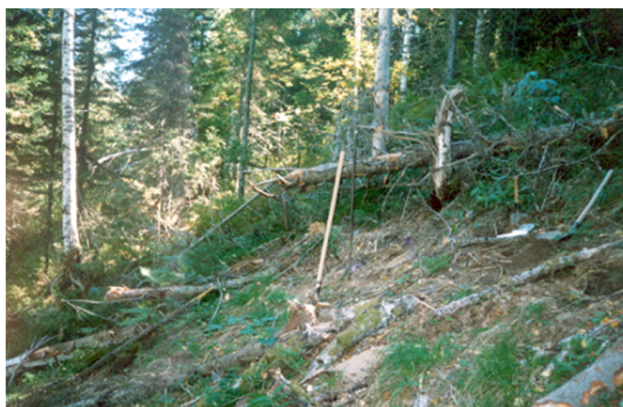
Рисунок 3 – ЗТ екінші сатыларының құлау аймағы. ҚА 310 Шығыс Қазақстан облысы