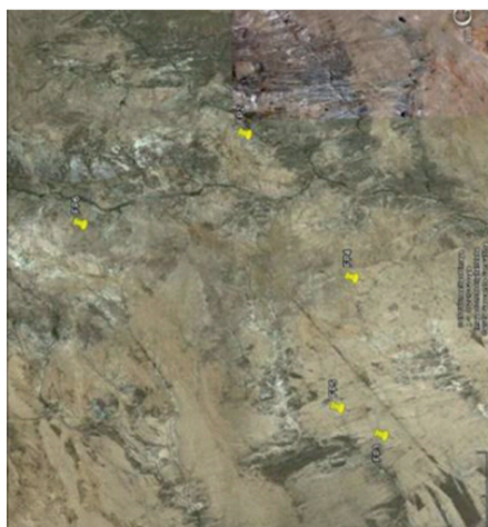
Рисунок 1 – Зымыран бөліктерінің құлау аймақтары. 2009-2010 ж аралығында Google карталарымен зерттелген. ( http://gri.sourceforge.net )

Алынған мәліметтер топырақтың СЕДМГ трансформация өнімдерімен ластануы тек құлау орындарының эпицентрінде ғана бар деген қорытынды жасауға мүмкіндік берді. Зымыран отынының төгілу аудандарының өлшемі әртүрлі болуы мүмкін - диаметрі 10 см-ден 2 м. "Протон" ЗТ-ның бірінші сатысының 1.1-ДМГ 6 отын бактары және 6 қозғалтқышты қондырғылары бар болғандықтан, құлау орнында бірнеше үлкен (20 см астам) және төгілген отынның көптеген шағын дақтары болуы мүмкін.