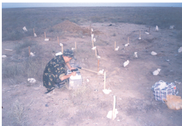
Рисунок 2 – ҚА 148 Қарағанды облысы аймағындағы, торлы сынамаларды жерден алу